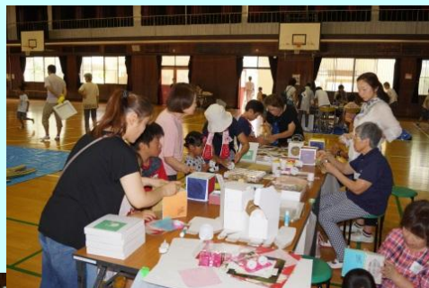
段ボールコーナー

今年で4回目の世代間交流「夏休み工作づくり」は、暑い体育館で☆段ボールコーナー☆折紙コーナー☆手芸コーナー☆竹細工コーナーを設け、それぞれ作品の下準備をして頂き、新作も多く提供頂いたボランティアの皆様有難うございました。参加者68名(子供32名)の皆さんが作品づくりを見守り支援し、子ども、お父さん、お母さん又おじいさん、おばあさんの三世代交流がにぎやかに、絆を深める楽しい一時を共に過ごすことが出来ました。これが地域づくりの一步だと痛感しました。みなさん有難うございました。