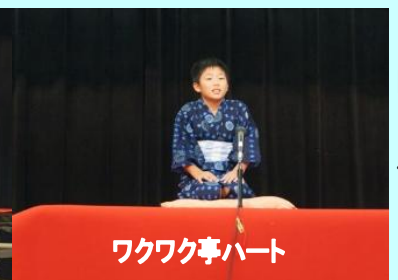
ワクワク亭ハート