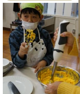
放課後の子ども達の居場所作り事業です

雪の降る寒い日もありましたが、合計 160 人ほどの子どもたちが参加してくれ、みんなで美味しく食べました。またおうちでも作ってみて欲しいですね。ご協力いただいた加茂小 P T A の皆さんありがとうございました。