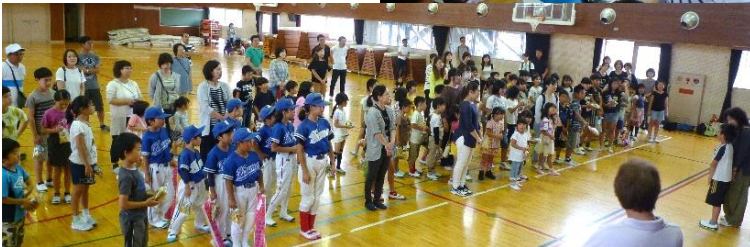
みんなで並んであいさつ