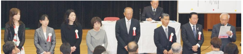
H30 年度新総務役員のみなさん