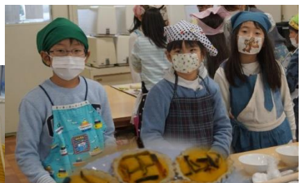
かぼちゃの皮でデコ♪