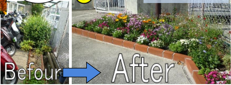
H30 年度は南花屋敷中央会館の予定です