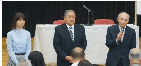
今回退任される方々