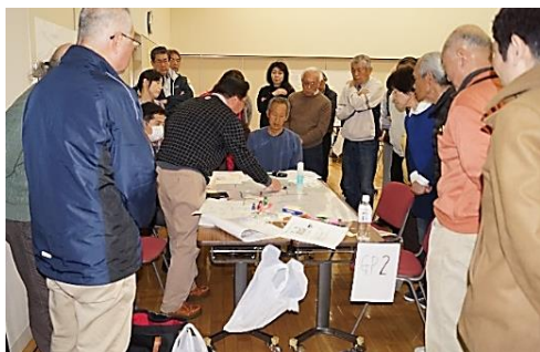
グループごとの発表