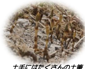
土手にはたくさんの土筆