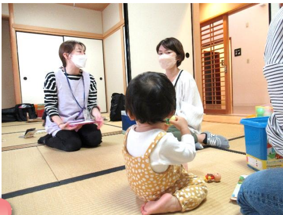
お子さんを遊ばせながら相談も♪