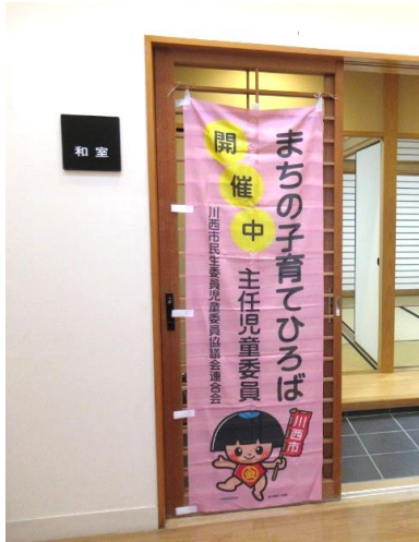
ピンクののぼりが目印です

発行 加茂小コミュニティ協議会 編集 広報委員会 発行部数：5,400 部（全戸配布） 〒666-0025 川西市加茂 3 丁目 13-23 （加茂ふれあい会館内） TEL・FAX 072-757-0210 https://kamokomi.site/ e-mail kamokomi@jttk.zaq.ne.jp