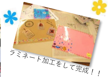
ラミネート加工をして完成!!