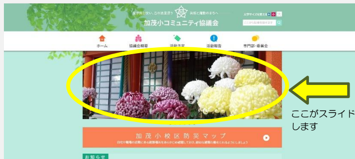
ここがスライド します