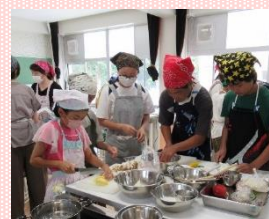
ジョイフル 夏休み小学生料理教室

―(永田)加茂まつりでは盆踊りをするのは初めてで大人もいっぱい。いっぱいの中、中学生が来てくれて、お店を切り盛りしてくれて本当に助かりました。