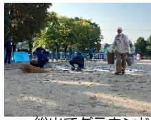
総出でグラウンド整備