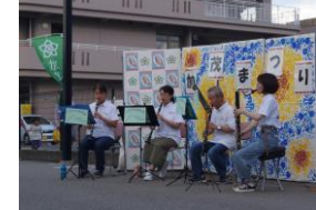
川西市吹奏楽団クラリネットアンサンブル