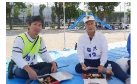
和やかな昼食タイム