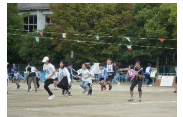
子ども大なわとび