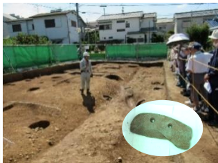
南花屋敷3丁目発掘調査説明会