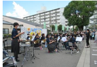
川西南中学校吹奏楽部