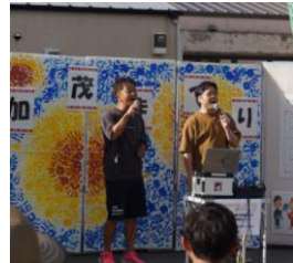
ハーモニック・ブレンド