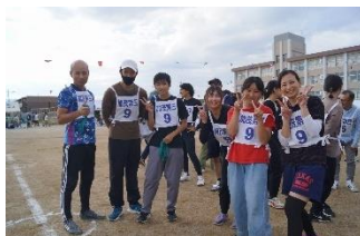
地区対抗リレー優勝の加茂第三チーム