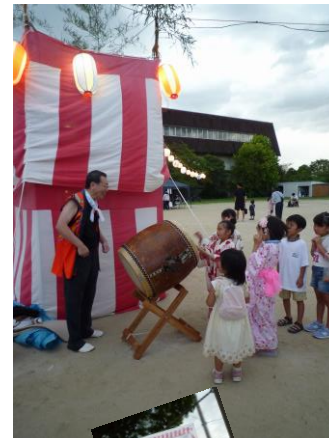
みんな笑顔でおどろう！加茂まつり