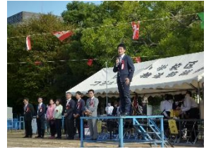
来賓の方々もたくさん