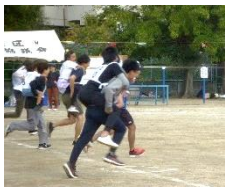
親子おんぶ&だっこ競走