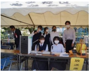
10/15 加茂コスポートデー 2年生5人が放送担当