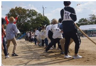
歴史に残る名勝負! 加茂に軍配