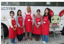
10月東洋食品短期大学での献血会にて