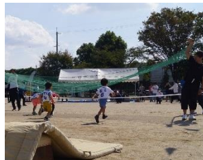
みんなでチャレンジ