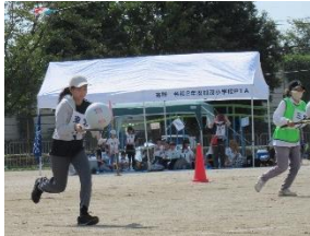
ソフトバレーリレー