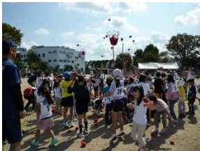
大人も子どももみんなで玉入れ