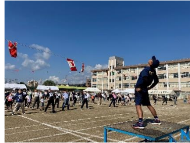
みんなでラジオ体操