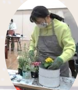
去年の寄せ植え教室の様子