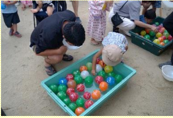
5人の南中生がヨーヨー釣りとお手伝いに来てくれました(中学生の映っている写真なし)