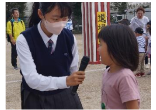
かけっこ一番インタビュー