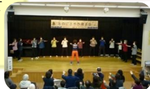
去年のにぎやか発表会の様子