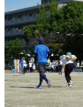
今年初「バックボール」