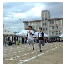
手に汗握る大接戦