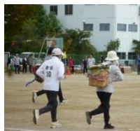
ペアで入 (ニュー) ボール